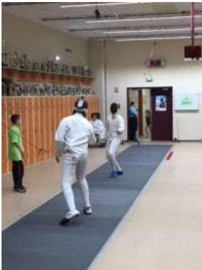
L'équipe de sabre championne de France