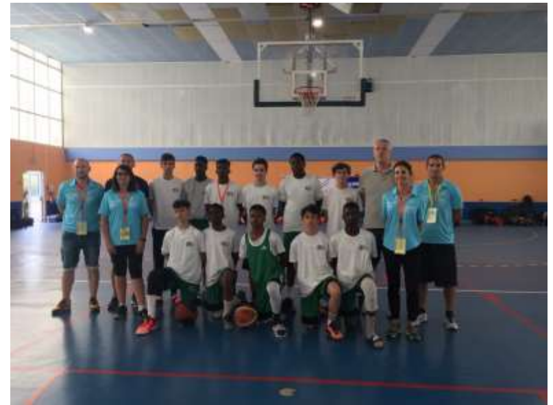
L'équipe minime garçons championne de France de basket.