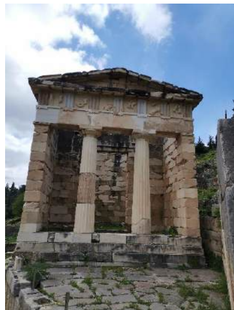
Frise de Siphnos ; le trésor des Athéniens

Jeudi 20 mars : après deux journées passées dans les montagnes grecques, nous revoici dans la capitale grecque. La matinée, passée dans le Musée National, nous fait réviser l'histoire, la mythologie et tout ce que nous avons vu ces derniers jours : l'or de Mycènes, la statuaire archaïque, classique et hellénistique, la céramique, les fresques de Santorin etc. Après ces nourritures spirituelles, place à des nourritures plus terrestres, place Monastiraki.