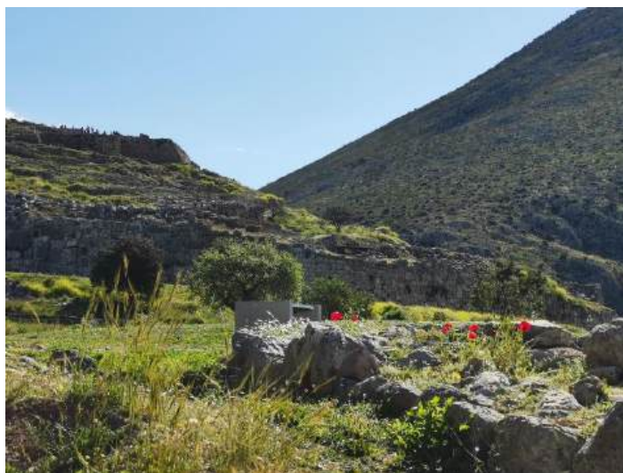
La citadelle mycénienne

Mardi 18 mars , nous sommes partis avant l'aurore pour traverser le canal de Corinthe puis visiter la mystérieuse cité de Mycènes, royaume d'Agamemnon et scènes des crimes de la famille des Atrides, avant d'entrer dans le Trésor d'Atrée où quelques élèves ont présenté un exposé. Nous n'avons pas manqué de rendre hommage à la dynastie mycénienne en déjeunant au restaurant du King Menelaos !