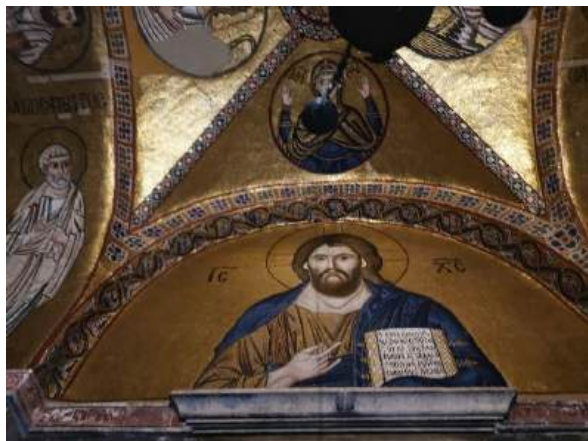
Le Christ Pantocrator

Mercredi 19 mars , le lever a été encore plus matinal afin de nous permettre de visiter le monastère orthodoxe d'Hosios Loukas et ses belles mosaïques témoignant du raffinement des artistes byzantins pour exprimer leur foi. La montagne est d'autant plus impressionnante que nous la voyons ... sous la neige !