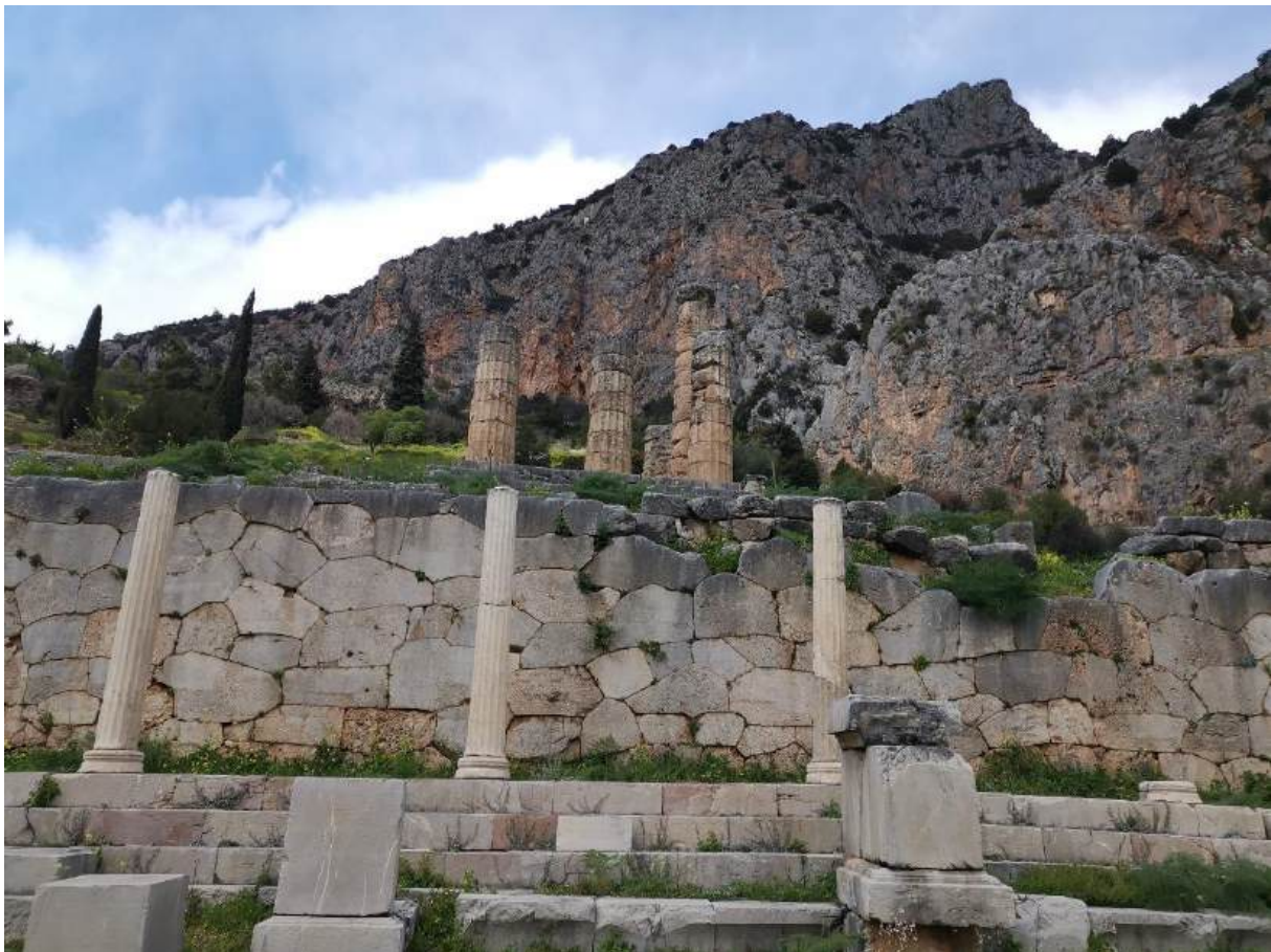
Le temple d'Apollon