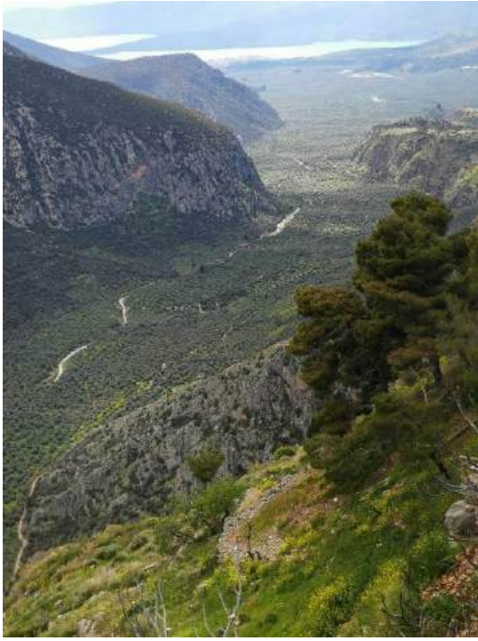
La plaine des oliviers ; le théâtre

Notre étape suivante a été le « nombril du monde », selon les Anciens : Delphes. Le sanctuaire du dieu Apollon est accroché à la montagne, sous la protection des deux falaises, les Phédriades, et il domine la mer des oliviers moutonnant jusqu'au golfe d'Itéa.